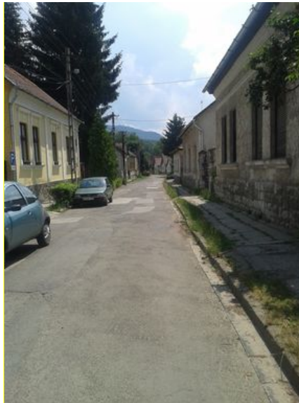
Jellemző utcakép a lakóterületről

A lakásépítésre alkalmas területek - legfeljebb kismértékű - bővítését minden esetben a község intézményi és műszaki infrastruktúra kapacitásaival összehangoltan kell ütemezni.