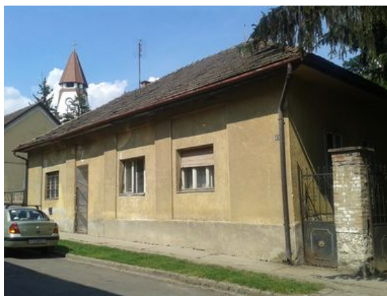
A Mackó ház jelenleg

A terület távolabbi fejlesztési célja, a szomszédos 773-as, és 774-es önkormányzati tulajdonú ingatlanokon szabadtéri piac létrehozása a Petőfi téri szolgáltatóház udvarának megnyitásával. A