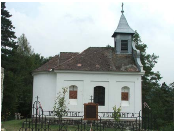
Kápolna a Kálvária dombon