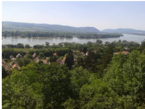
Kilátás a Dunakanyarra

Zebegény táji és domborzati adottságai egyedülállóan változatosak. A hegyvölgyes domborzat, a nagy szintkülönbségek a természetjárás különböző válfajai mellett speciálisan sportolási célokra is hasznosítható. A településen megvan a létjogosultsága edzőtáboroknak, a sportturizmus fejlesztése egy sajátos irányvonal és cél lehet. Ez a fejlesztési irány egy átfogó sportkonceptió keretében kidolgozandó.