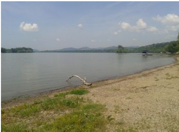
Duna part a Napraforgó utca és a strand között