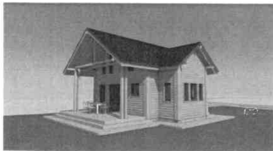
látványterv udvar felől