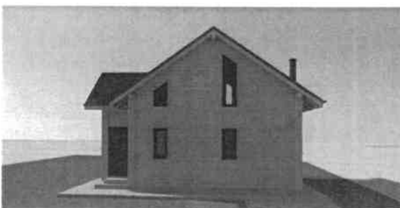
látványterv utca felől