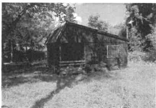
A jelenlegi állapot: